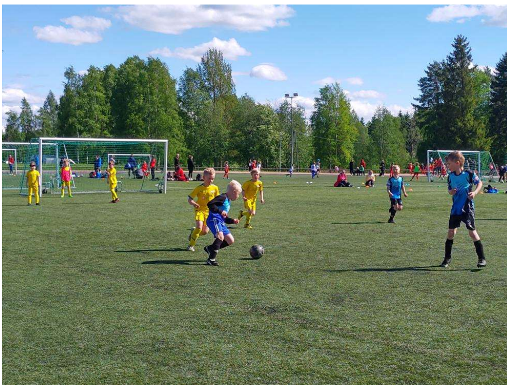
Monelle pienelle pelaajalle Tervareitti-turnaus on ensimmäinen suuri turnaustapahtuma, joka aloittaa kesän jalkapallokauden. Arkistokuva.

Mari ja Tero Lehmikangas Ponkilan Pantterit ry