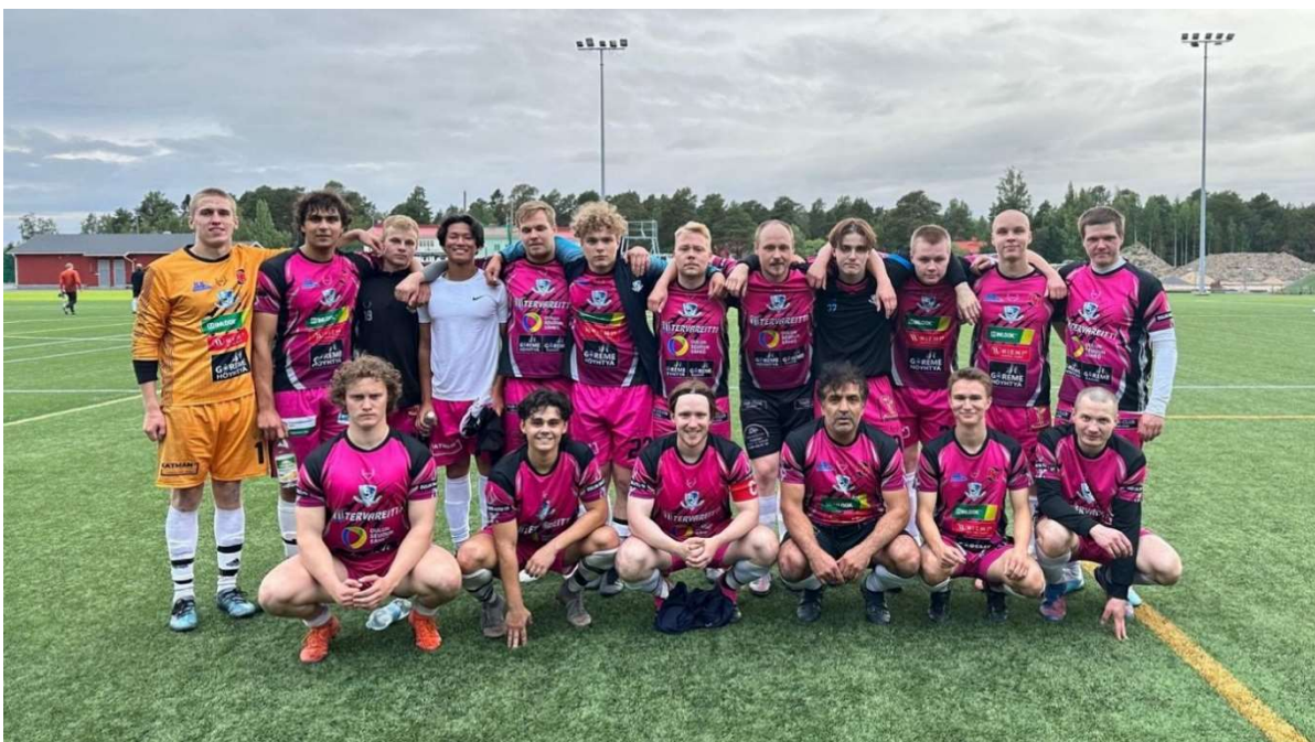
PonPa/2, joukkuekuva 3.7.2023 pelatun JPJ – PonPa/2 ottelun jälkeen (tulos 1–3)

Vahvasti alkaneen, mutta lopulta viidenteen sijaan päättyneen 2022 kauden jälkeen Panterit lähtivät uuteen kauteen selkeänä tavoitteenaan nousu Neloseen.